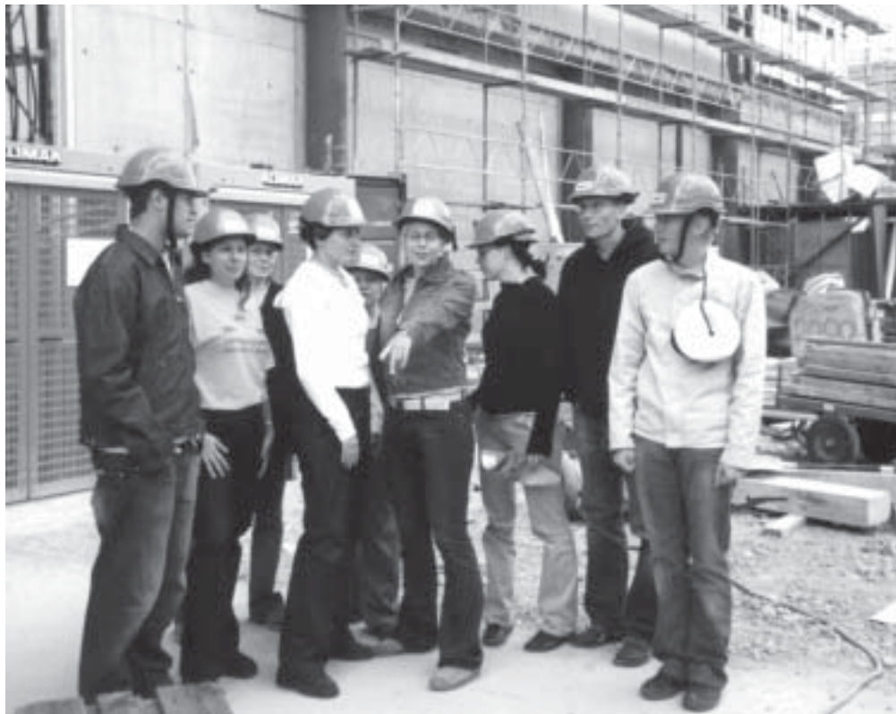
Exculla NCC:n työmaalla

Tämä ei ole totta. Miten voi tulla pää kipeäksi ja pahaolo vaikka enhän minä mitään juonut. Vai joinko sittenkin? Ihanaa bussi odottaa jo ulkona. Äkkiä sinne nuokkumaan. Nytkö jo ollaan perillä. Ois täällä bussissa vähän kauemmin voitu istua. Ihanaa tosin, että saadaan heti ekana