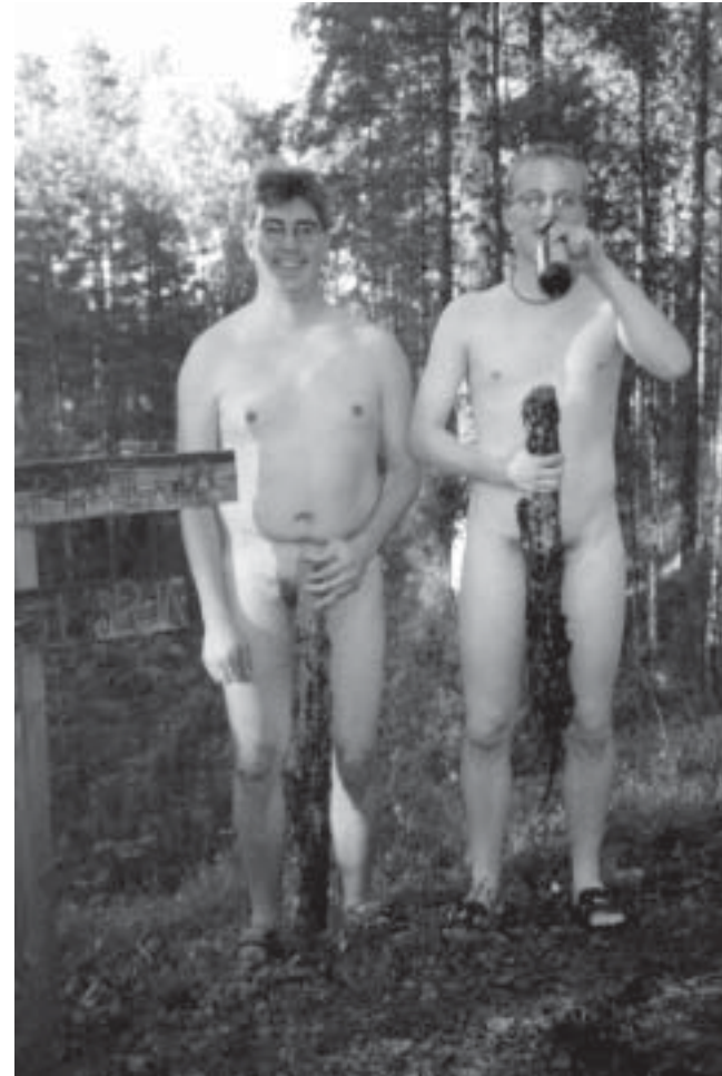
Raadin kesäpojat vapaana suomalaisessa luonnossa...