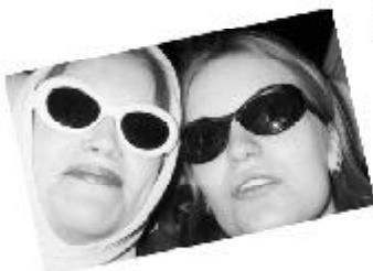
Thelma & Louise