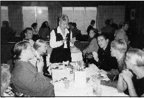
Nyt me syömme hyvin!

päätömittajan Tarmo-nollat taulussa-Savolaisen aateloiminnin.