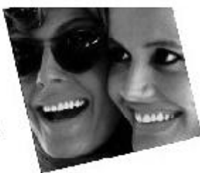
Thelma & Louise