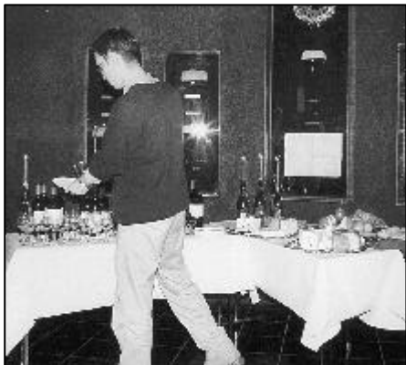
Anders sekä viini- ja juustopöytä