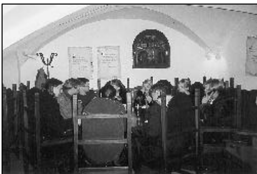
Vanhoja rakennuksia: kirkko ja ravintola