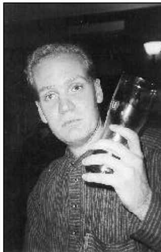
Eräs BaltIK-xq:lle osallistunut