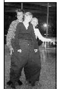
Meistä on moneksi!