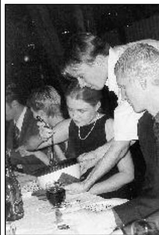
Phuksi raataa lakkipisteidensä eteen

Kerrankin jouduimme ihan oikeasti raatamaan lakkipisteidemme eteen, ja on mukavaa yletä tästä työläiskastista Suuresta Sammosta juovaan joukkoon jo ensi vuonna