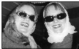
Thelma & Louise

Ja kaiken tämän mielenkiintoisen informaation löysimme matkapäivikses-tämme, kreikkalaisesta naistenlehti Ret-sinasta, joka on myös sillanrakentajien ammattijulkaisu (tämän kuulimme Suomessa miespuoliselta phuksikapulta, joka ei tunnustautunut lukijaksi).