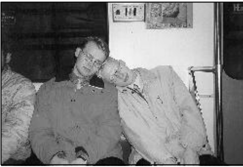
Stressaantunut puheenjohtajisto väsähti kesken xq:n.

Komea ja ilmeisen kallis menopeli Talvipalatsissa.